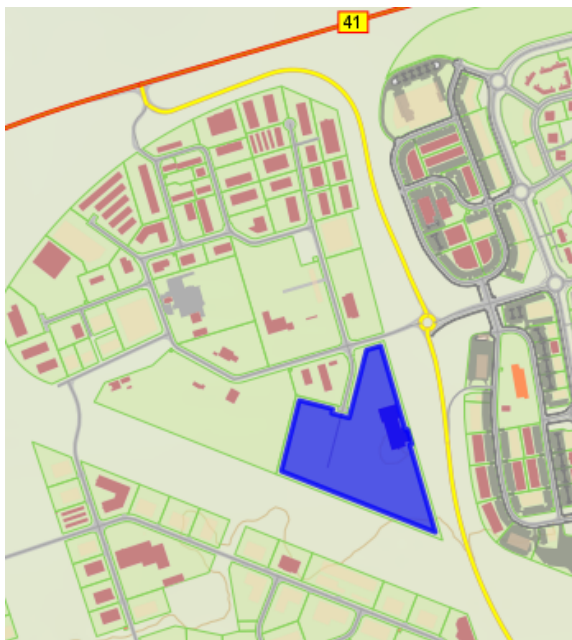
Lóð Berghellu 1

Tímabil stöðuleyfis er tímabundið (hámark 12 mán.). Tjaldhýsið verði boltað niður í malbik. Fyrirhuguð staðsetning er við lóðarmörk á austanverðri lóðinni, nálægt húsnæði Efnamóttökunnar. Tjald verði 12 x 12 m að grunnfleti, hæð er ekki tilgreind en virðist vera innan marka leyfilegrar mænishæðar skv. gildandi deiliskipulagi. Staðsetning er utan byggingarreits lóðarinnar.